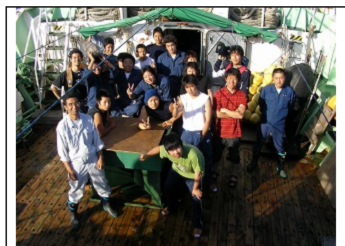
NHK取材クルーと(東奥丸)